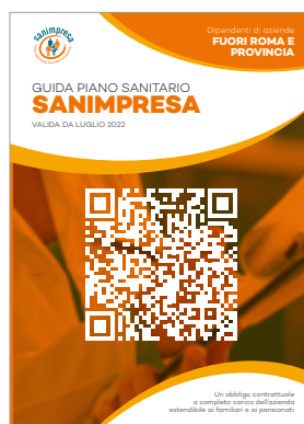
FUORI ROMA E PROVINCIA