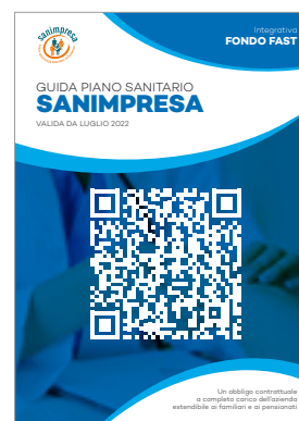
INTEGRATIVO FONDO FAST