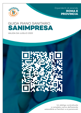
ROMA E PROVINCIA

La convenzione resta, pertanto, l'unico strumento valido per un completo ed esauriente riferimento.