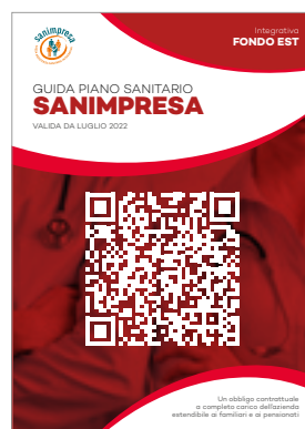
INTEGRATIVO FONDO EST